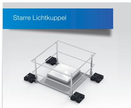
Standardumwehrung für Lichtkuppeln mit Oberlichtfunktion.