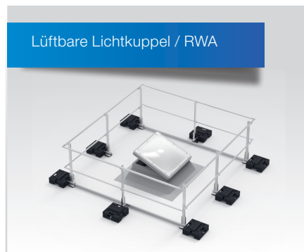
Variante in variablen Größen mit genügend Freiraum für aufklappbare Lichtkuppeln und RWA.