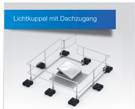
Ausführung mit selbstschließender Türöffnung zur Sicherung von Lichtkuppeln mit Ausstiegsmöglichkeit.